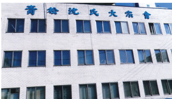
▲ 환경정비 後 모습