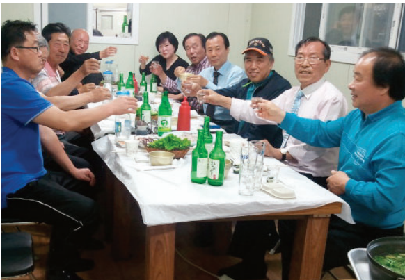
△ 김포군수공종회 일가들과 함께 대중회 상화(상임부회장)의 제창으로 종사발전을 위한 건배 모습

이자리에서 양섭 회장은 가까운 곳에 사는 일가들끼리라도 자주 모임을 갖자는 제의와 함께 대중회 상화 부회장의 “대중회 발전과 일가분들의 건강을 위하여...” 건배로 시작하여 시종일관 화기애애한 분위기로 친목모임을 마쳤다.