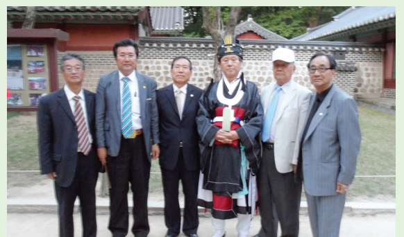
정전 아헌관: 대전·충남지구중회장 현근

初獻: 光澤(안성중회장) 亞獻: 언호 終獻: 상욱 執禮: 載玉 大祝: 相直