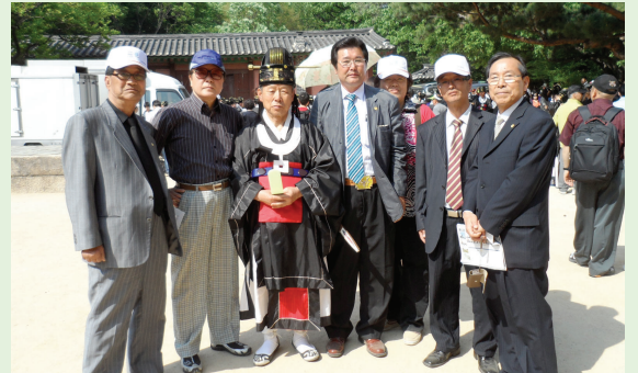
영녕전 아헌관: 대중회 용규이사