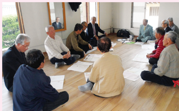
▲ 악은공종회 탐방 시 회의장면