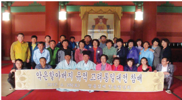
△ 청송 청년회원 일행 고려통일대전 내 악은공 유적지 참배 후 기념촬영

참배를 마친 회원 일행은 오는 길에 인근의 통일전망대에도 잠시 둘러보는 등 모처럼 하루 뜻깊은 시간을 가지면서 회원상호간 친목과 화합의 장을 마련하였다.