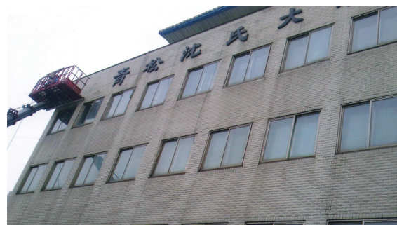
▲ 환경정비 前 모습

전국 종인 분들께서도 서울 중앙에(서울 중구) 위치한 청송심씨대종회 5층 건물을 보시면 심문(沈門)의 자긍심을 느끼시게 되실 것입니다. 서울에 오시면 대종회도 방문하셔서 차도 한잔 나누시며 종사발전에 건설적인 의견도 함께 나눠주시기를 바랍니다.