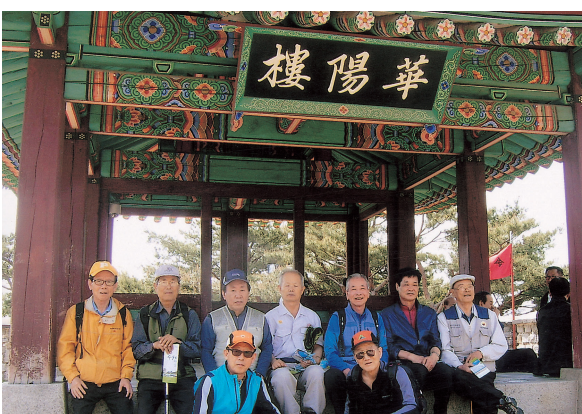
△ 더위를 식히며 수원시내가 한눈에 바라보이는 화양루 앞에서...

름다웠으며 정조대왕께서 모친 혜경궁홍씨의 진찬연을 열었던 궁이기도 하다. 역사의 숨결이 묻어있는 행궁을 둘러본 후 근처에 유명한 순두부집에서 막걸리를 나누며 점심식사를 하고 다음달에도 우리의 고유 역사문화가 있는 곳을 선정하여 모이기로 하고 역사문화탐방 산행을 마쳤다.