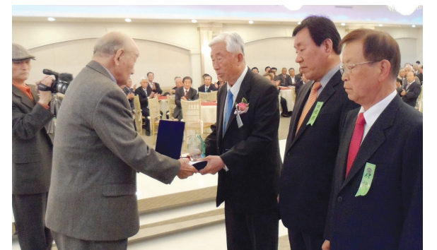
△ 공로패 수여(대중회 前 경주 부회장, 前 종혁 총무이사, 前 증복 재무이사)