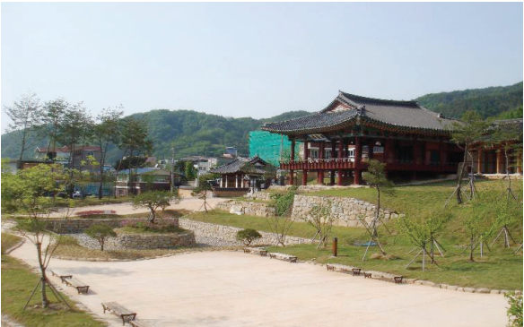
△ 주변정비사업으로 새롭게 단장된 찬경루 주변 모습

한편, 청송군은 앞으로 이곳을 지역민과 관광객들에게 도심속의 쉼터로 제공하고 청소년들에게도 상시로 개방하여 역사문화체험의 현장으로 적극 활용할 계획이다.