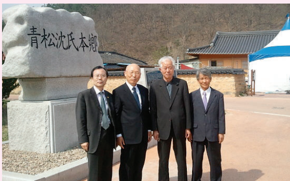
▲ 청송심씨본향 표석 앞에서 (좌로부터 두번째) 대종회 相和 상임부회장

■ 다음 종회탐방은 7월초 (전남) [五世조(繼年) 지성주사공종회(知成洲事公宗會 회장(相錄))] 예정입니다.