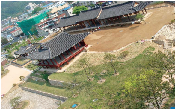
△ 공중에서 내려다 본 찬경루와 운봉관 주변 모습