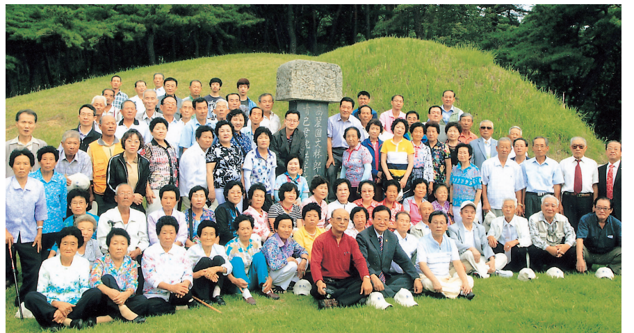
▲곡성종회 회원들의 시조묘소 참배 후 다함께 묘소앞에서 사진촬영

다음날 아침 먼저 중대 산소를 참배하였는데, 할아버님! 중대산소 묘전에 석등이라도 하나쯤 있었으면... 했습니다. 만지송은 예사로운 수목이 아닌 듯 했습니다. 우리 청송 집안의 상징역할을 면면히 해 나가리라 생각되었습니다. 다시 차량으로 이동하여 보광산 산소에 올랐습니다. 연전 성묘 때와 달리 등산로가 정비되어 차량이 산소에 근접할 수 있어서 연로한 종인들도 모두 묘정에 모였고 엄숙한 분위기로 고유제를 모셨는데, "때는 2011년(신묘) 8월 28일, 청송 심씨 25세손 곡성종회장 정식은 감히