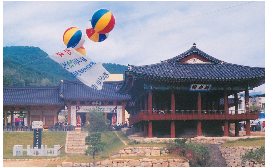
▲소헌공원(昭憲公園) 준공 축하 애드벌룬(대중회 찬조) - 경축/소헌공원 준공/청송심씨대중회

2011년 9월 30일 300여명의 청송군민이 참석한 가운데 성대하게 소헌공원 명명식이 거행되었다.