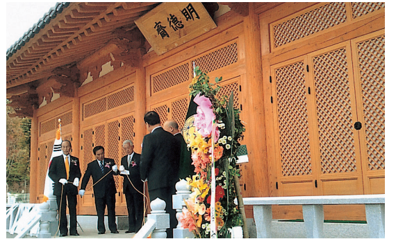
▲명덕재 현판 제막식 (오른쪽부터 안효공 상덕회장, 대종회 상하부회장, 판관공 상렬회장, 공숙공 응섭회장, 이경공 주택회장)