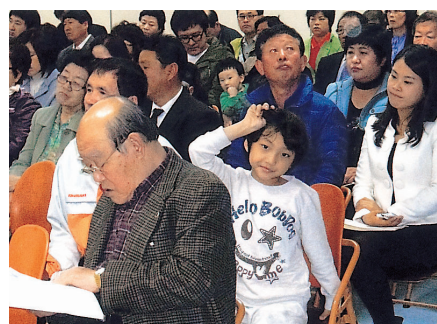
▲부산지역의 많은 참석 일가분들의 교육수강 장면 (할아버지와 손자의 모습이 보기 좋습니다)