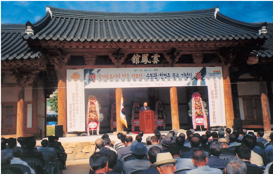
▲소헌공원(昭憲公園) 준공식 축사(대중회 宜洛 회장)를 대독하는 相和 상임부회장