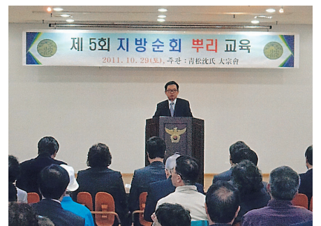
▲ 제5회 지방순회 뿌리교육을 후원하신 부산총회 상군 회장님의 인사 장면