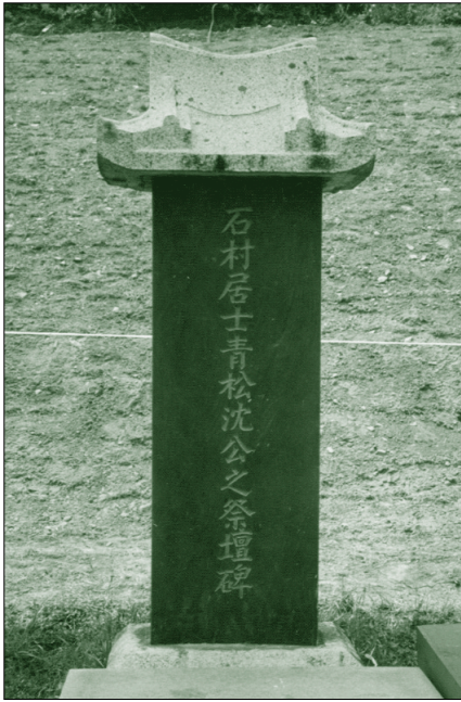
▶ 石村公 之 壇