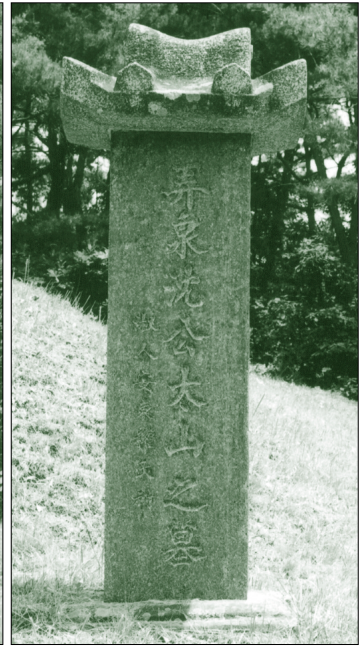
▶ 太山 묘표석

六世祖 石村公 諱 孝尚 行狀 村 (靑島人) (上祖) (石 誠) (喪) (晚愚公) (孝 參奉) 二 (洪 德) (顯陵) (名聲) 孚 (文林郎) (衛尉寺丞) 가 (錢送) 가 (白首看 族) (嶺南) (巨 淵) (閣門祗候) (老年) 雲 가 가 德行 (山陰石畚村) (退去) (龍) (官職) (學業) (能沂)가 三 (遺文) 가 (退老亭) (遺墟)가 (門下侍中) (靑華府院君) (元符) (典理判書) (經書) (姑叔) (閔農隱) (杜門洞) (史記) 가 (忠節) (天潤) (查察) 가 (家狀) (令同正) (太宗大王) (旌門) (大體) (官) (帶) (枕) 獻 (徵驗) (生卒) (官) (衾) (四銘) (儀) 高宗 三十六年 己未 五月 하순에 爵 (德行) (事功) (邵康節) (司馬溫公) (司果) 동정대부전 승정원 좌부승지검경연참찬관 (後生) 가 (家乘) (世) (太山) (司果) 춘추관수찬관 동양(東陽)신태관(申泰觀)이 지음 錄 (邑誌) (野史) (太山) (司果) ▶ 2페이지 상단에 계속