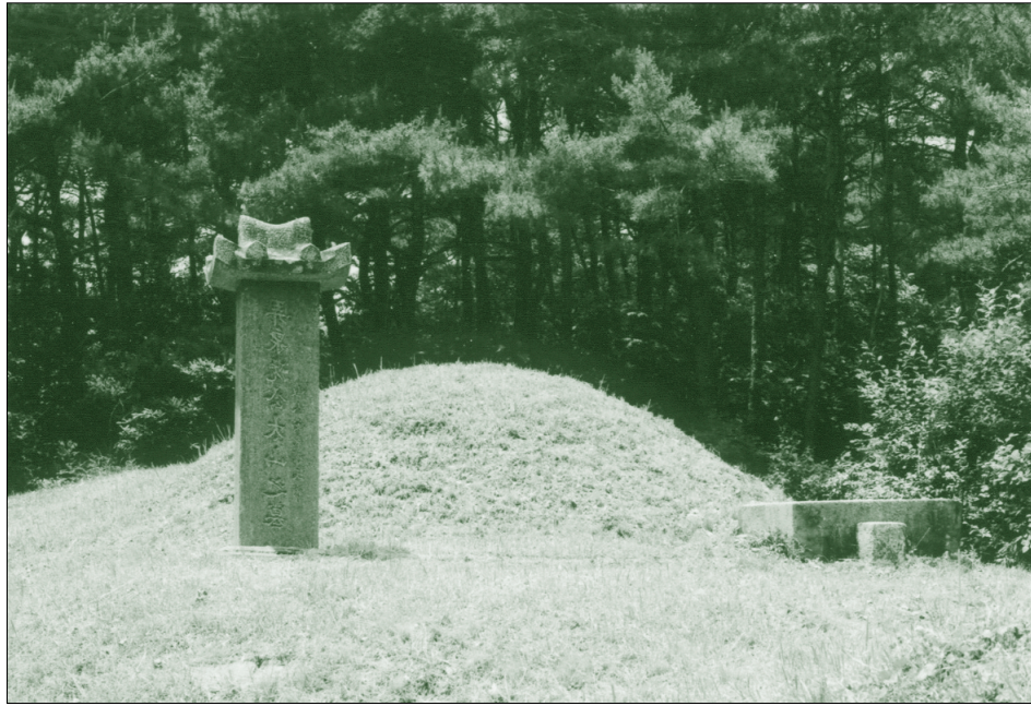
▶ 부사과공 묘소