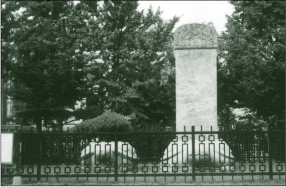
三田渡碑 (清太宗頌德碑)