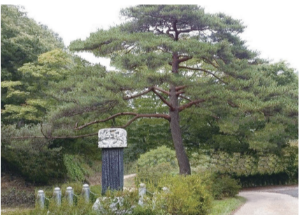
시조모소 입구 웅장한 소나무