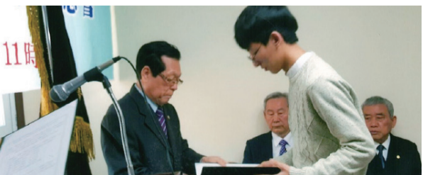
청주중회는 2016년 정기총회에서 공로패 수여 및 총300만원의 장학금을 전달하며 학생들에게 꿈과 희망을 주었다.