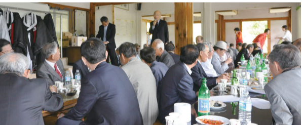
악은공중회 총회에서 회장으로 선출된 상화 대종회부회장의 종회장 수락 인사장면