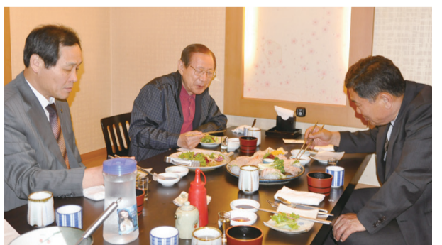
좌로부터 언태 총무이사, 상은 고문, 광섭 이사