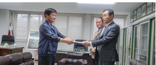
사어공중회는(회장 인섭) 대종회를 방문하여 재각건립기금과 종보찬조 2백만원을 헌성하였다.