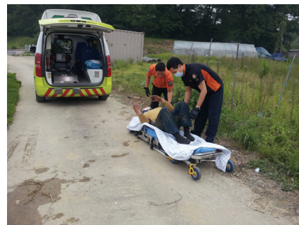
119응급차에 실리는 부상자