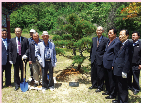
갑보대중회 회장 사복시정공종회 방문 기념 식수