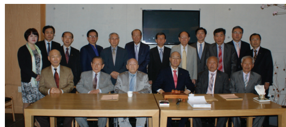
청송심씨대종회 회장 이·취임식 및 회장단회의 개최 기념촬영(2014.5.8)