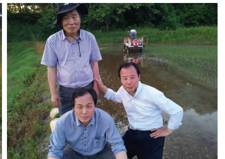
공포분위기 속에서 모내기를 도려하고 있는 집행부