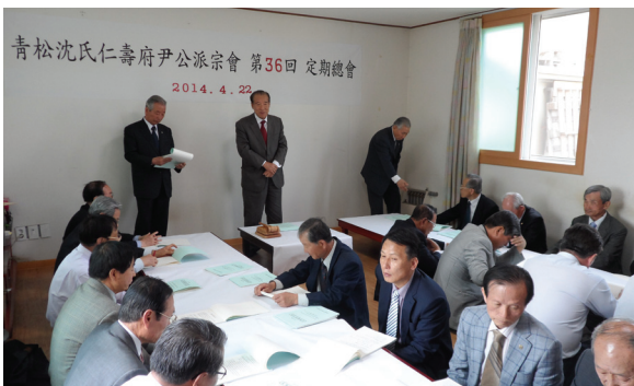
2014. 4. 22 망세정공재실