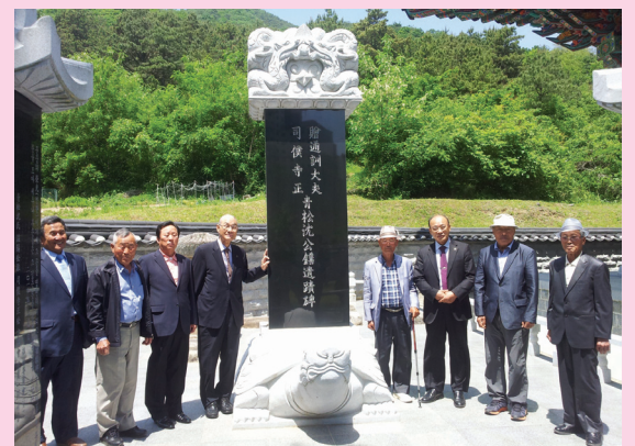
사복시정공 사적비 앞에서