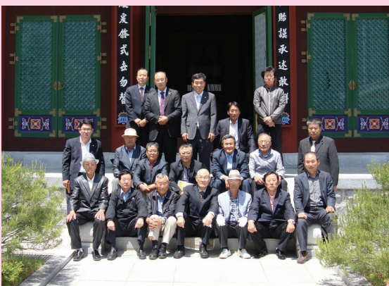
감의재 앞에서 사복시정공종회 임원과 함께