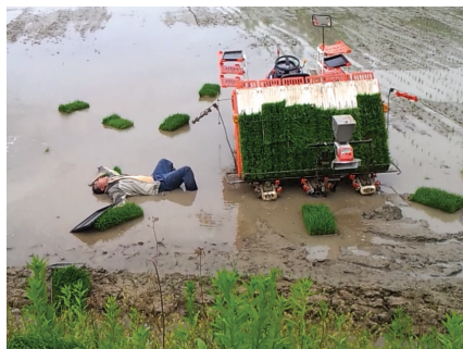
모내기 방해꾼이 던진 모판에 맞아 쓰러진 위탁경작자