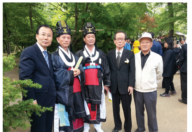
종묘대제 아헌관 : 前 총무이사 수영