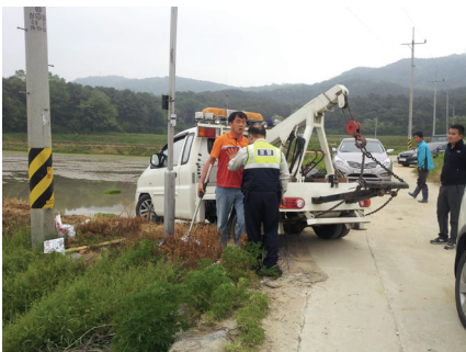
쇠파이프로 모내기 방해.위협

서는 안성에 내려가 2박3일 동안 침식을 하며 기어코 위토를 지키고 온 것에 자부심을 느끼면서 앞으로 불의에는 절대로 물러서지 않겠다고 굳게 굳게 결심하였다.